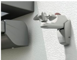
Sonnen- und Windwächter