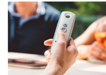
Funkmotoren & Handsender

Erhöhen Sie den Komfort Ihrer Markise mit ausgewähltem Zubehör, z.B.